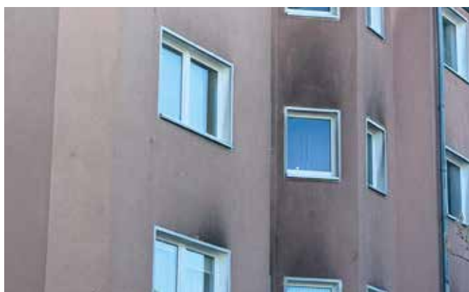
Turnplatz 8 – Zustand der Fassade