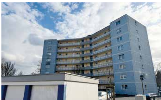
Am Goldberg 37

In der Instandhaltung erfolgen Treppenhausanstriche in den Objekten „Am Goldberg 32–44“, Fassadenanstriche an der Adresse „Am Turnplatz 8“ sowie die Neugestaltung von Außenstellplätzen in der „Elisabeth-Lindner-Str. 1“. Außerdem werden die Außenstellplätze entlang der „Brückenstraße“ neu angelegt. ●