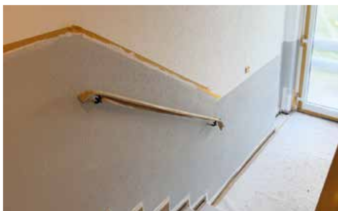
Am Goldberg 32-44 – Treppenhausanstriche