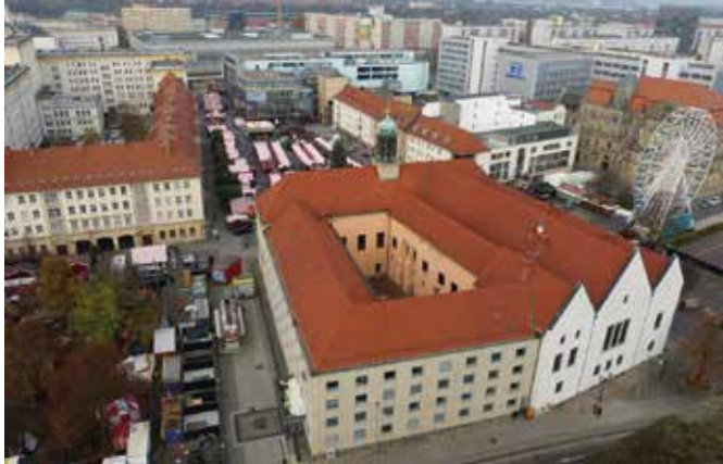
Das Alte Rathaus (Rückseite), das sich am Alten Markt befindet.