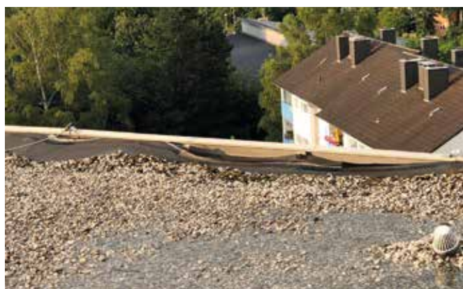
Am Goldberg 37 – Erneuerung Flachdach