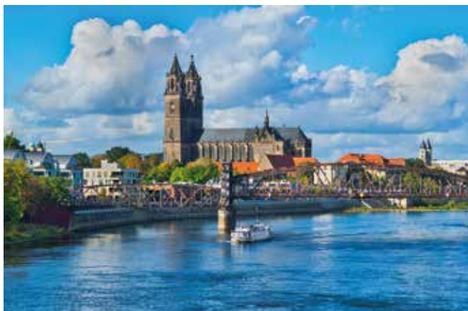
Die Elbe mit Hubbrücke, dahinter der Dom.