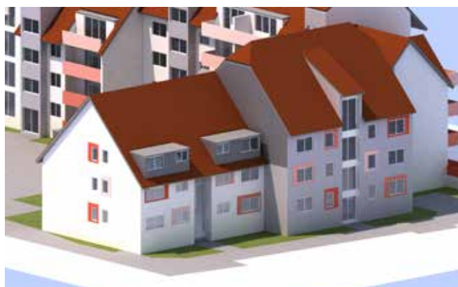
Turnplatz 8 – Farbkonzept