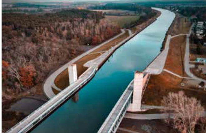
Die Kanalbrücke Magdeburg ist die längste Kanalbrücke Europas.