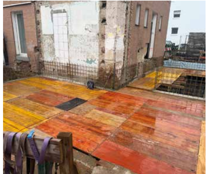
aktueller Bautenstand: die Bodenplatte ist gegossen, Kellerwände sind betoniert, Kellerdecke ist vorbereitet