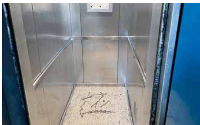
Am Goldberg 37 – Erneuerung Aufzug