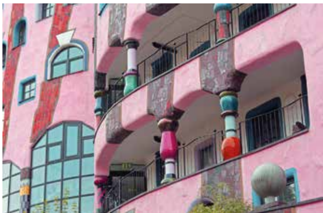
Die Grüne Zitadelle, besser bekannt als das „Hundertwasserhaus“.

Wer andere historische Städte kennt, merkt schnell: Magdeburg erzählt seine Geschichte anders. Statt geschlossener Kulisse mischen sich Domtürme mit Nachkriegsbauten, Hundertwasser-Fassade mit Elbauenpark, Technikgeschichte mit Spitzenhandball. Gerade dieser Kontrast macht den Reiz aus: Zwischen Kirchen und Kanalbrücken, Fangesängen und Elbwiesen erlebt man eine Stadt, die ihre Vergangenheit nicht versteckt, sondern als Kraftquelle für Gegenwart und Zukunft nutzt.